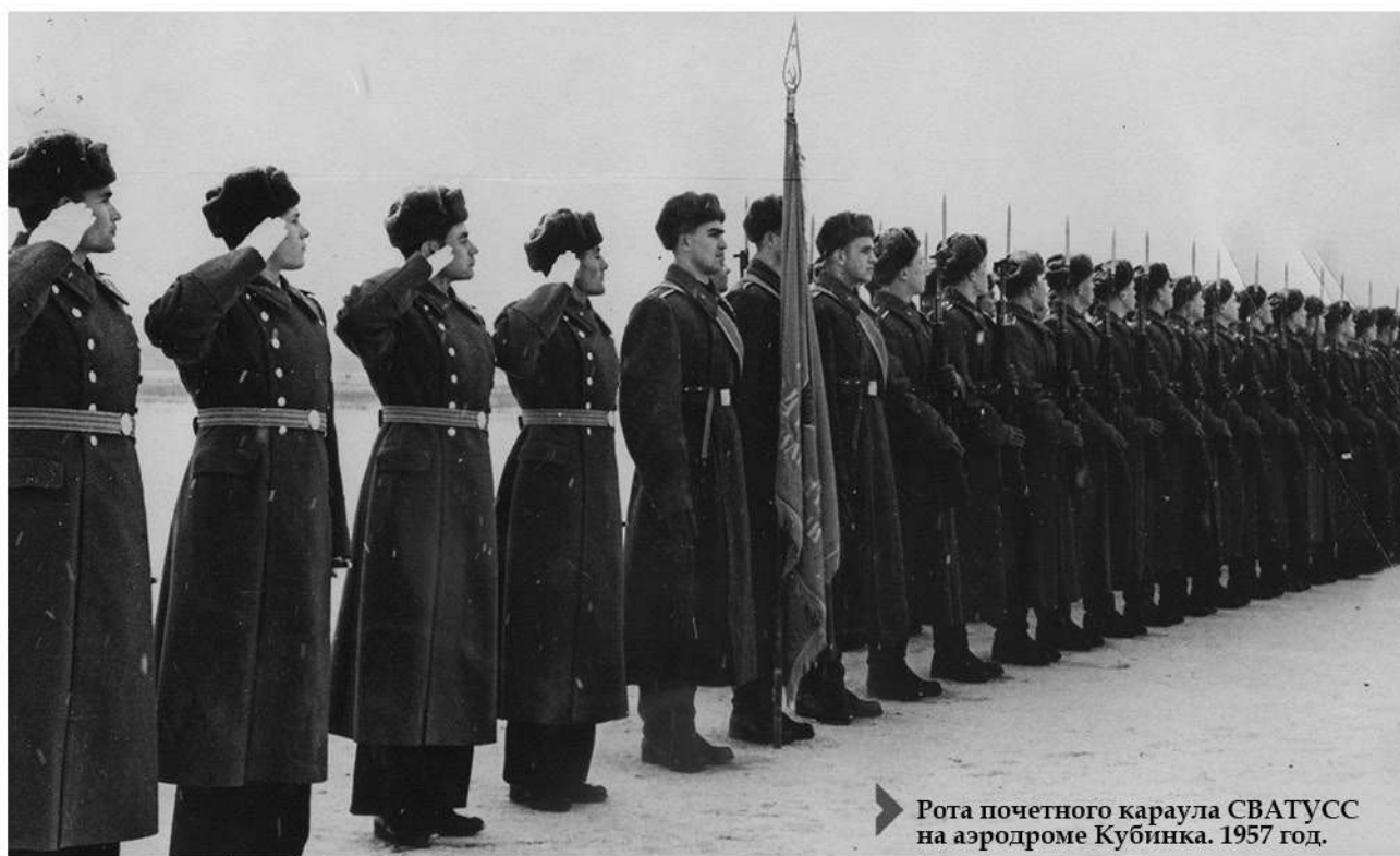
▶ Рота почетного караула СВАТУСС на аэродроме Кубинка. 1957 год.

Серпуховский филиал военной академии РВСН имени Петра Великого за свою почти восьмидесятилетнюю историю пережил много славных событий. Как известно, в далеком 1948-м году 2-я Московская авиационная школа авиамехаников спецслужб ВВС Красной армии, от которой ведет свою историю Серпуховский военный вуз, была преобразована в Серпуховское военное авиационно-техническое училище спецслужб ВВС (СВАТУСС). Но одна из страниц истории училища имеет государственное значение.