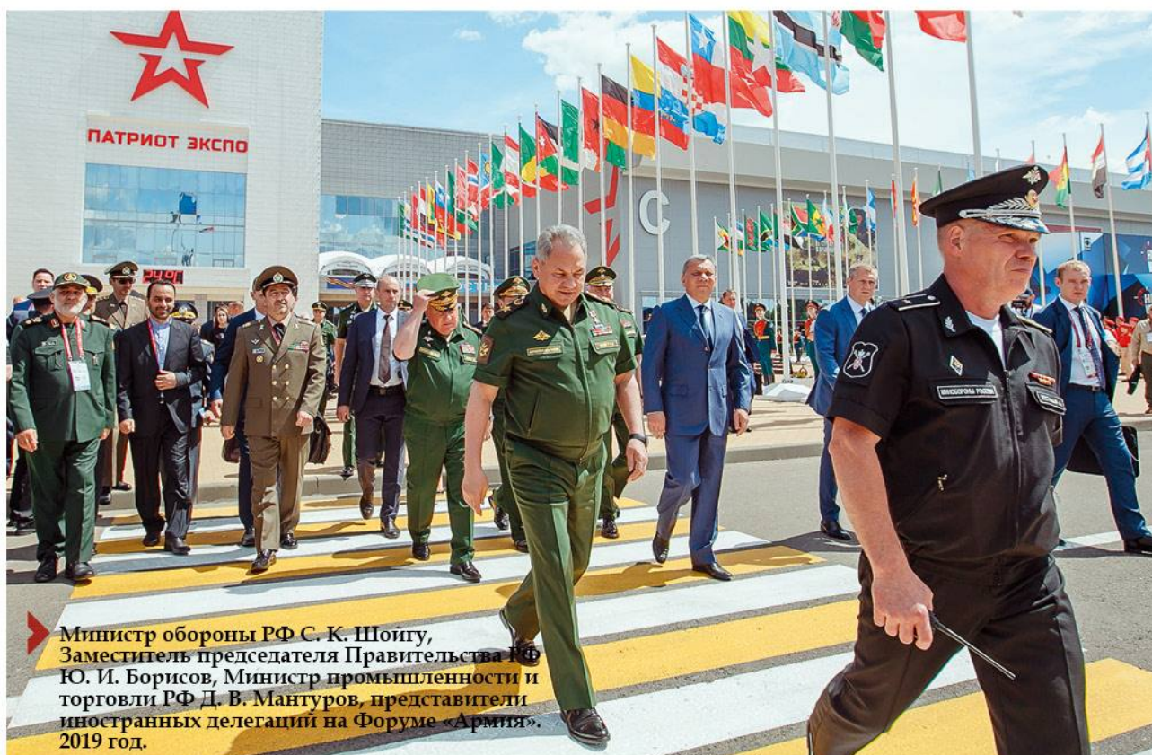
▶ Министр обороны РФ С. К. Шойгу, Заместитель председателя Правительства РФ Ю. И. Борисов, Министр промышленности и торговли РФ Д. В. Мантуров, представители иностранных делегаций на Форуме «Армия», 2019 год.

17 декабря исполняется 60 лет со дня создания самого могучего рода войск Вооруженных сил нашего Отечества — Ракетных войск стратегического назначения. Срок небольшой, но и не малый — в нем уместилась история нашего государства, нашей армии и общества за послевоенную историю. Это были годы тяжелейших испытаний, которые выпали на долю первых ракетчиков — вчерашних фронтовиков, ученых и испытателей, инженеров и рабочих, — десятков тысяч людей, принявших участие в создании и становлении Ракетных войск стратегического назначения. Это годы побед и трагедий, пронизанные невидимым, на первый взгляд, подвигом тех, кто возводил первые стартовые позиции и осваивал ракетные комплексы, кто формировал систему поддержания боевой готовности и боевого дежурства, кто готовил кадры для воинских частей и подразделений РВСН.