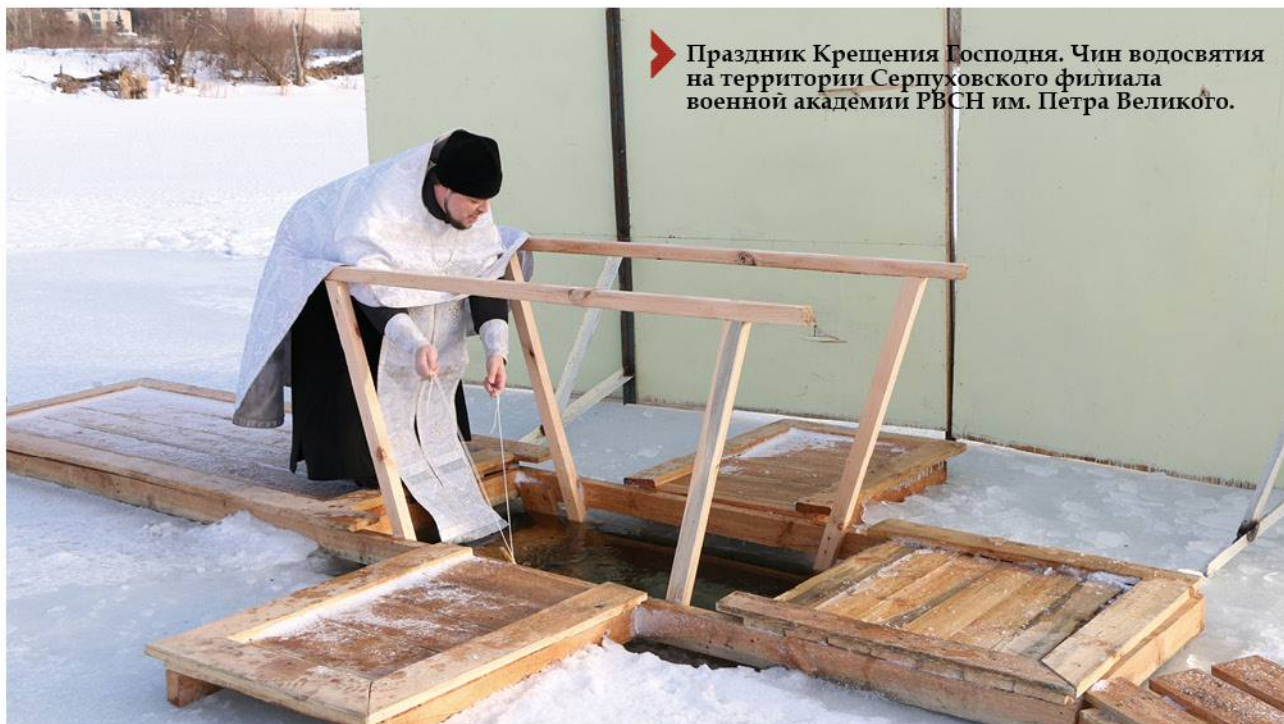
▶ Праздник Крещения Господня. Чин водосвятия на территории Серпуховского филиала военной академии РВСН им. Петра Великого.