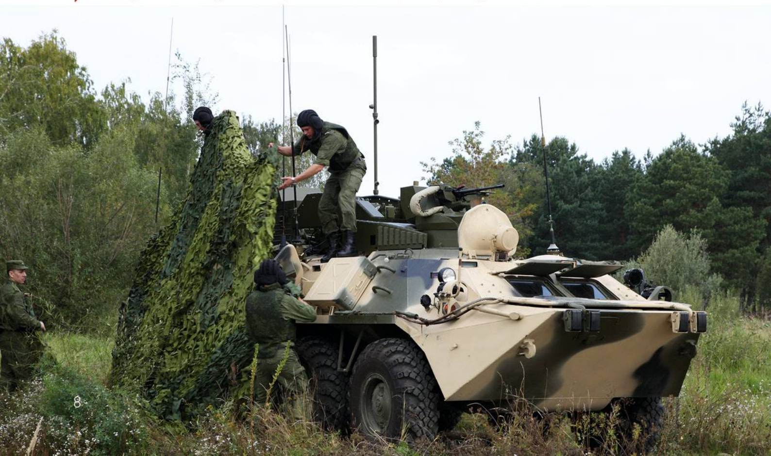
▶ Маскировка боевой противодиверсионной машины (БПДМ) «Тайфун».