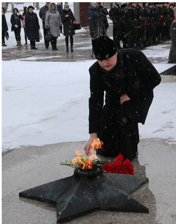
▶ Ни одна памятная дата не проходит без участия священнослужителей.

священников в войсках и Петр I. Он законодательно подтвердил: быть священнослужителям при каждом полку и корабле, и с первой четверти XVIII века назначения священнослужителей в