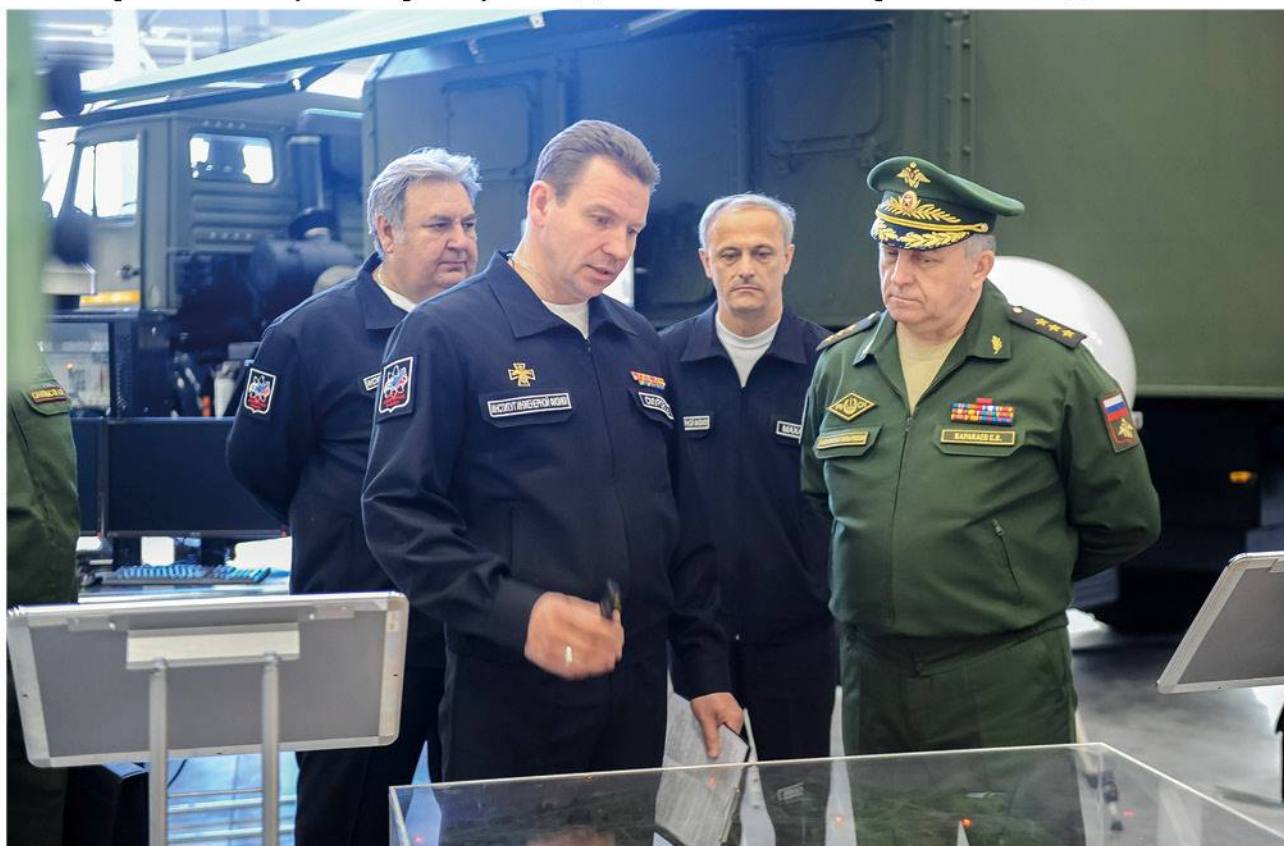
➤ Доклад первого вице-президента МОУ «ИИФ» С. В. Смурова командующему РВСН, генерал-полковнику С. В. Каракаеву на заседании коллегии Минобороны РФ. 2017 год.