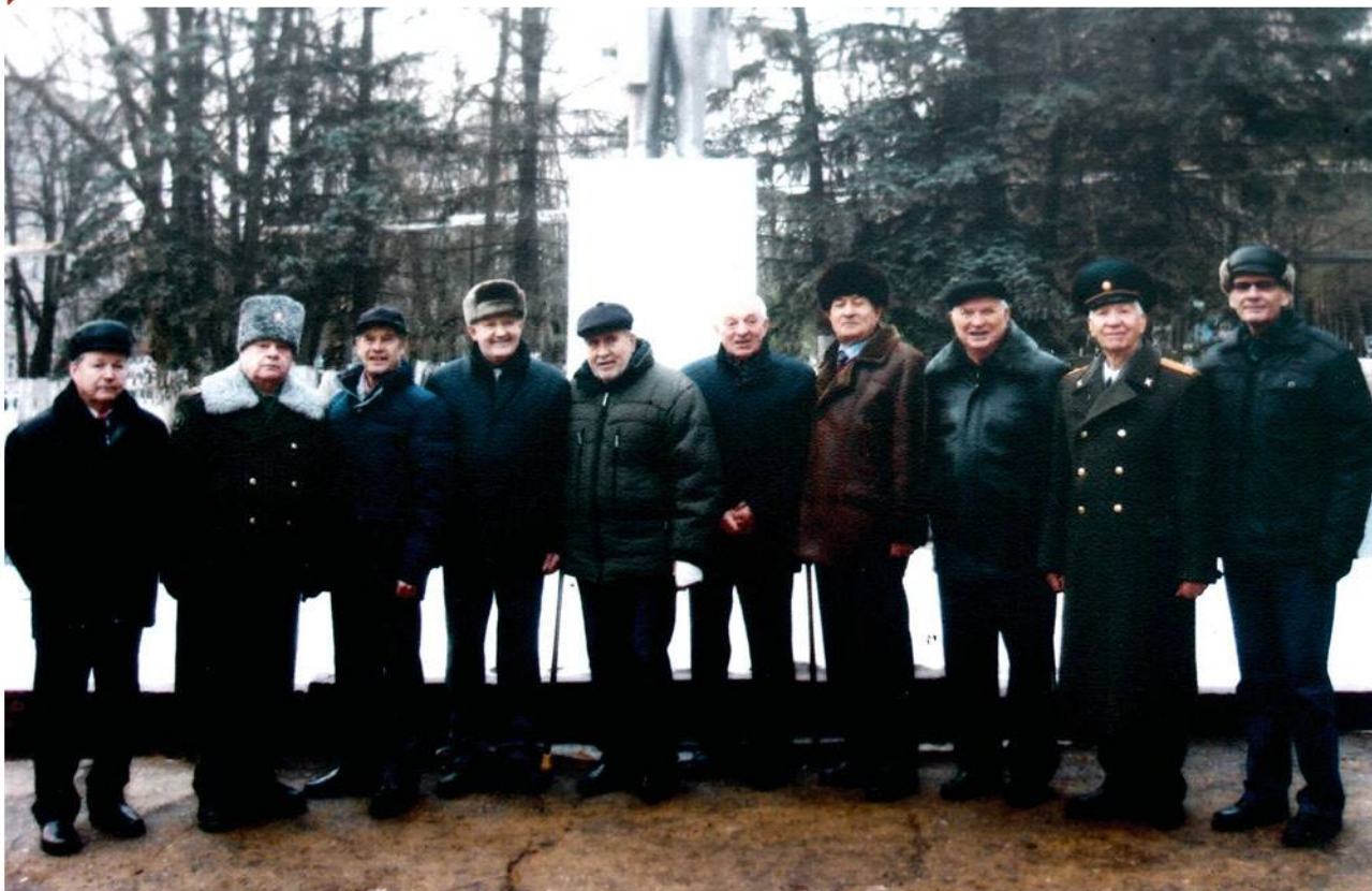
▶ Ветераны роты почетного караула в родном училище. 2015 год.