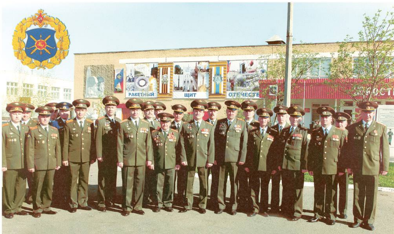
▶ Празднование Дня Победы в 54-й гвардейской ордена Кутузова второй степени ракетной дивизии (г. Тейково). 2009 год.