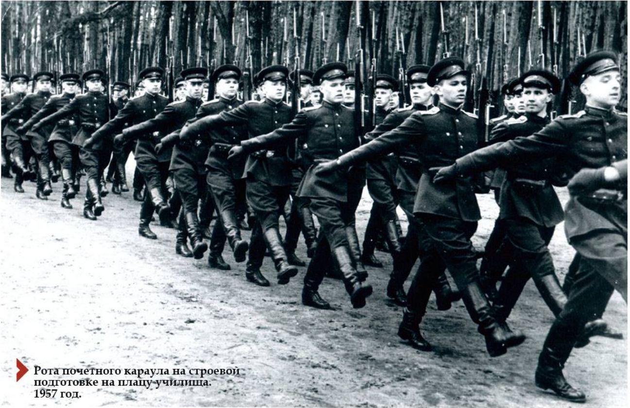
➤ Рота почетного караула на строевой подготовке на плацу училища. 1957 год.