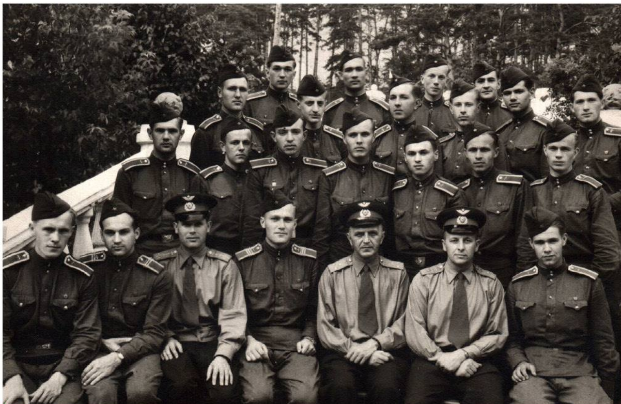
▶ Личный состав 16-го классного отделения 1-й роты с начальником училища, полковником Н. Я. Кобельковым и командиром роты, майором С. К. Зелинским.