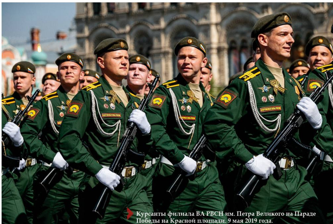
Курсанты филиала ВА РВСН им. Петра Великого на Параде Победы на Красной площади. 9 мая 2019 года.

Большой плюс военного вуза, как я считаю, это режим, он прививает привычку правильно