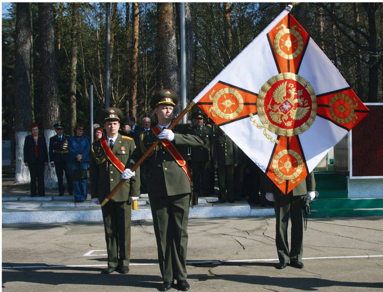
➤ Вручение боевого знамени нового образца Серпуховскому военному институту РВ. 2008 год.