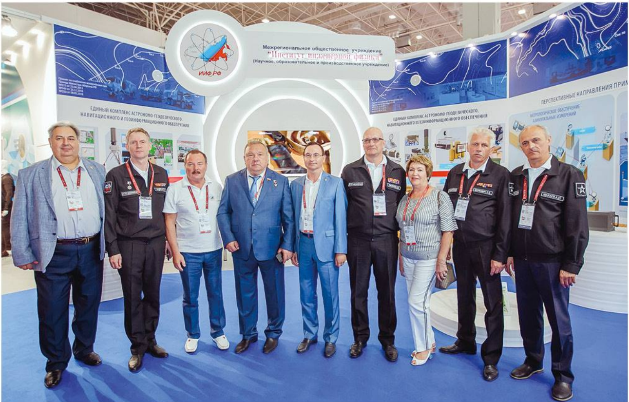
▶ Председатель Комитета по обороне Госдумы РФ В. А. Шаманов и руководство МОУ «ИИФ» на форуме «Армия», 2019 год.