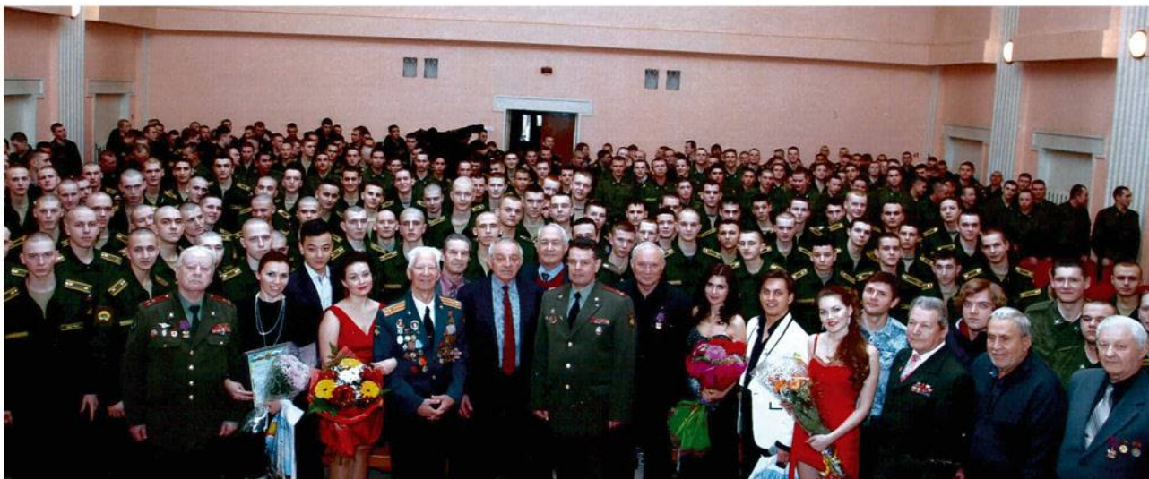
➤ Встреча ветеранов роты почетного караула с курсантами филиала ВА РВСН и артистами культурного центра ВС РФ. 2015 год.