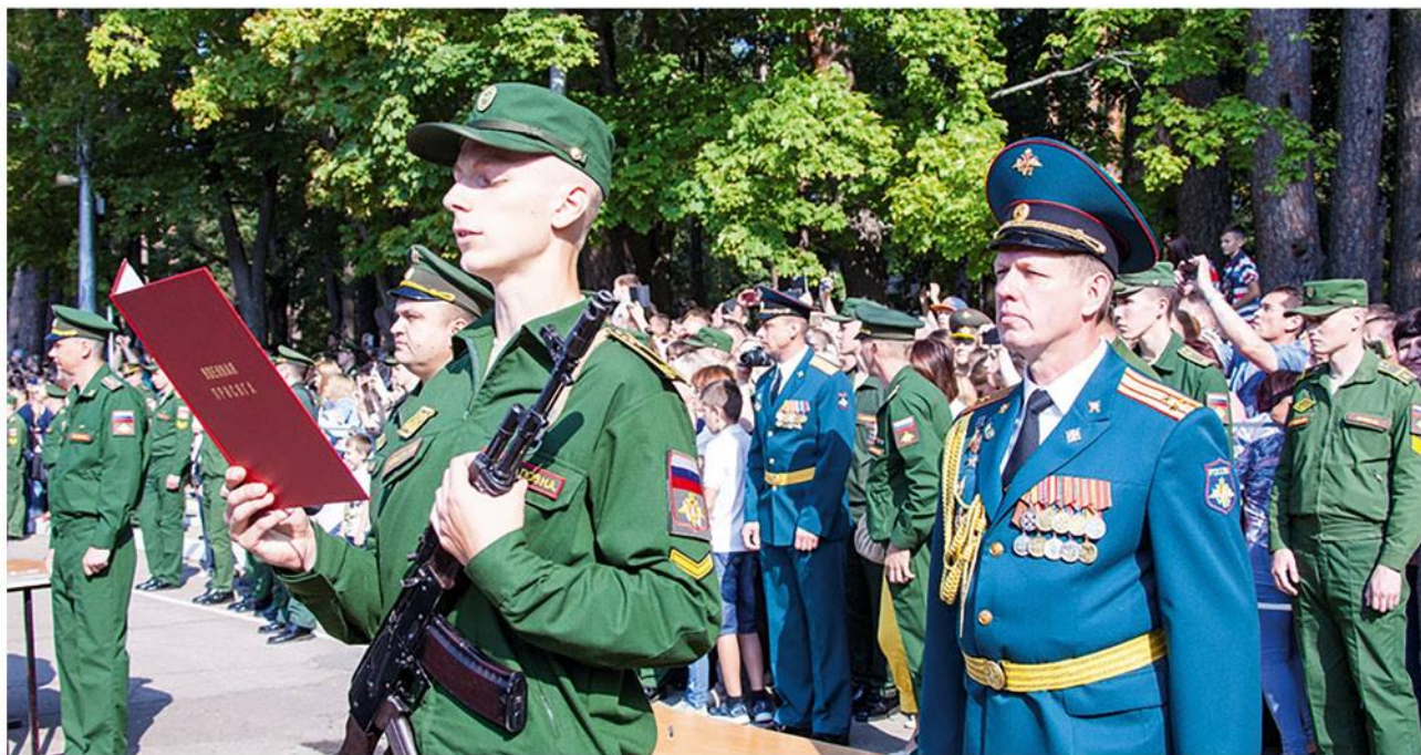
Военная присяга в филиале ВА РВСН им. Петра Великого. 2018 год.

был удостоен звания Героя Советского Союза за мужество и героизм, проявленные при форсировании Днепра. В послевоенные годы школа продолжала подготовку авиационных специалистов, в том числе и для вооруженных сил Албании, Болгарии, Северной Кореи и Югославии.