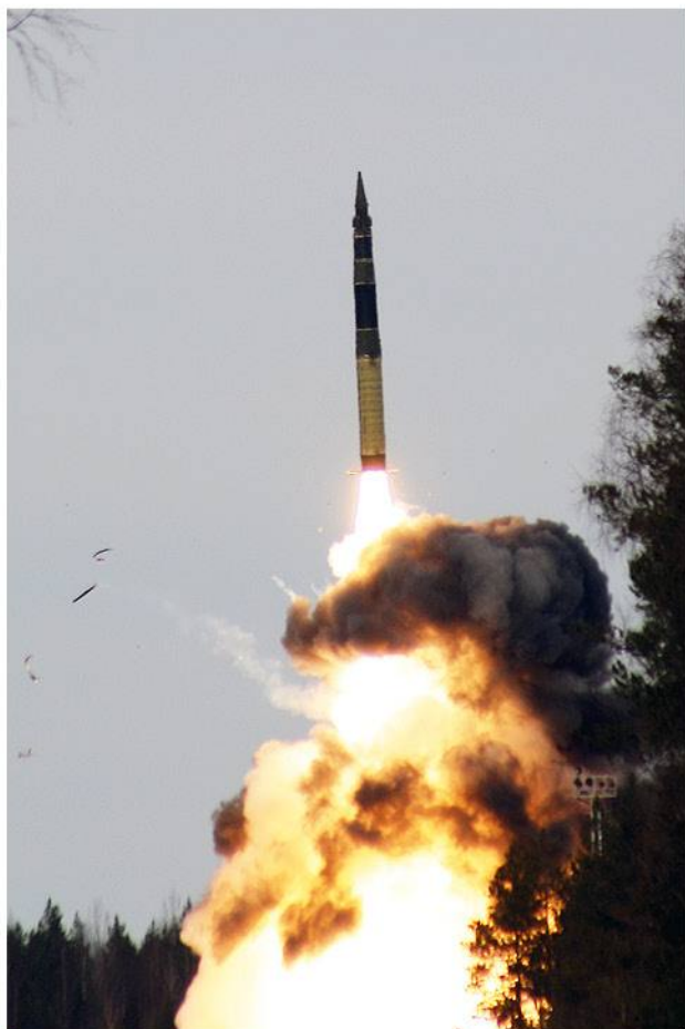
▶ Пуск межконтинентальной баллистической ракеты (МБР) «Тополь».

применению. Решение задач, связанных с боевой готовностью, достигается не только наличием современного вооружения и военной техники, но и тем, кто и как это оружие будет применять. Эксплуатация современных видов вооружения предъявляет все новые требования к квалификации офицерских кадров. В настоящее время в решении глобальных стратегических задач роль офицерского корпуса многократно возрастает. Современных стратегических ракетчиков отличают профессионализм, основательная техническая подготовка, широкий кругозор, высокий уровень общей и военной культуры.