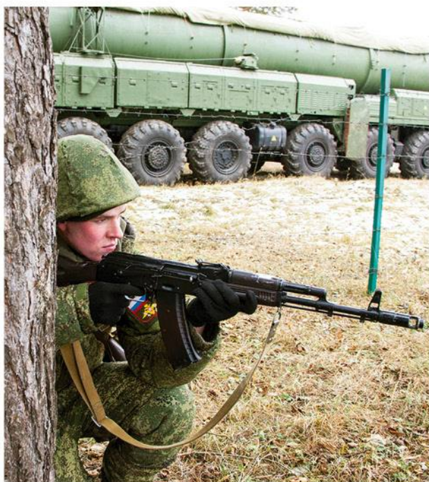
▶ Тактические учения в филиале ВА РВСН им. Петра Великого. 2017 год.

принимает участие в Параде на Красной площади, посвященном Победе советского народа в Великой Отечественной войне 1941-1945 годов. Более тысячи офицеров и курсантов вуза награждены медалями Министерства обороны Российской Федерации «За участие в военном параде в День Победы».