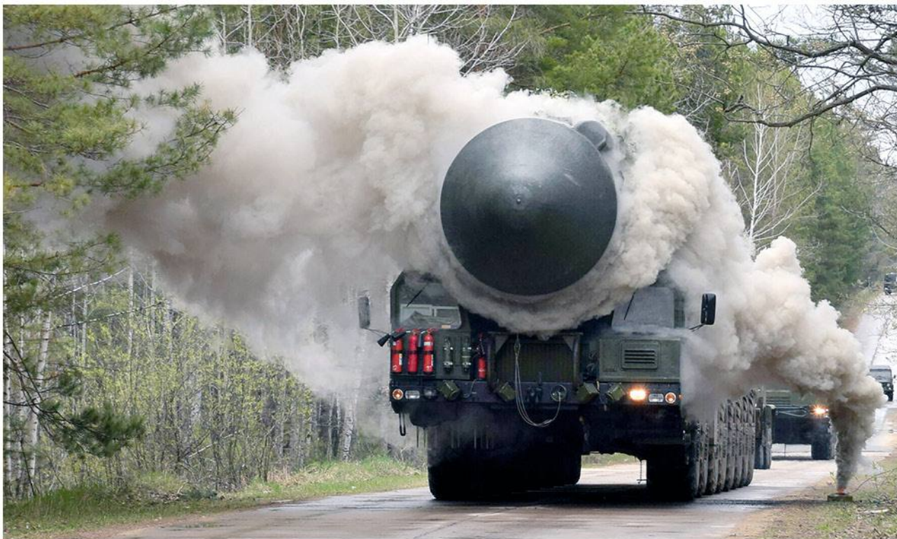
▶ Автономная пусковая установка подвижного грунтового ракетного комплекса (АПУ ПГРК) «Ярс» на марше.

Н ачиная с 1946 года, в СССР разрабатывалось и создавалось ракетно-ядерное оружие, первые образцы управляемых баллистических ракет. До 1965 года шёл этап формирования и становления Ракетных войск стратегического назначения как вида Вооруженных сил СССР. В 1965-1973 годы РВСН были оснащены комплексами второго поколения, что обеспечило достижение военно-стратегического паритета между СССР и США, а с 1973 по 1985 годы — ракетными комплексами третьего поколения с разделяющимися головными частями и средствами преодоления противоракетной обороны противника.