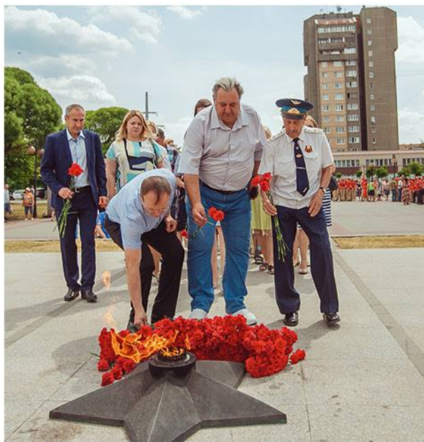
➤ Возложение цветов к мемориалу воинской славы в День России. 12 июня 2019 года.