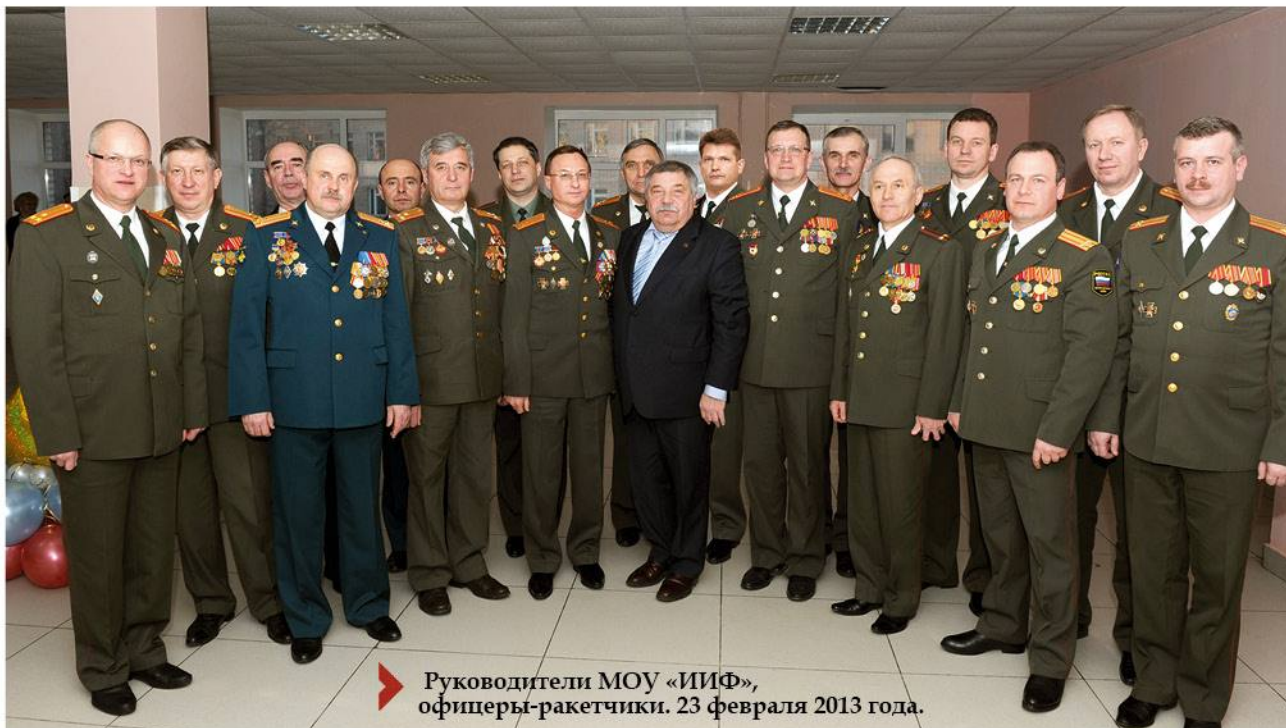
➤ Руководители МОУ «ИИФ», офицеры-ракетчики. 23 февраля 2013 года.

научно-педагогический потенциал военного института и Института инженерной физики представлен целой плеядой ученых — руководителей кафедр, ведущих отделов и служб военного вуза, занимающих сегодня ответственные посты в Институте инженерной физики — это