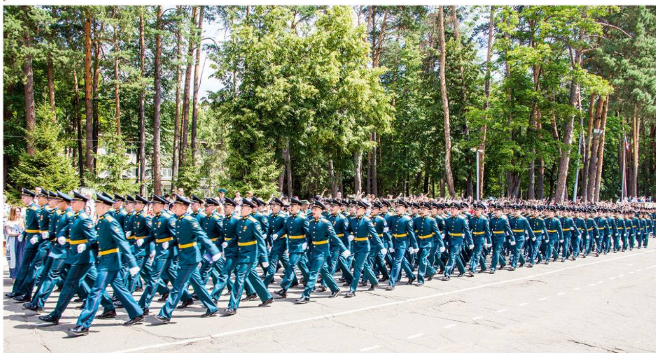
▶ Выпуск лейтенантов в филиале ВА РВСН им. Петра Великого. 21 июня 2019 года.