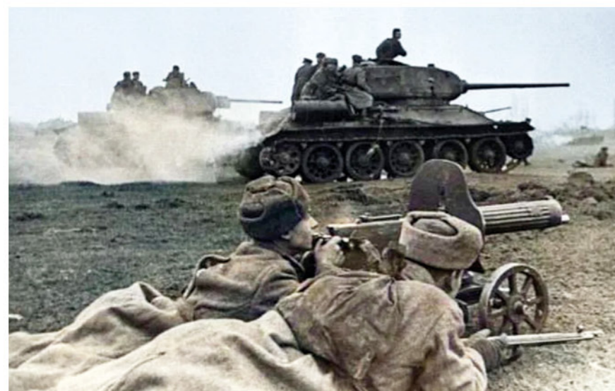
➤ Так шаг за шагом советские войска освобождали Европу от коричневой чумы.