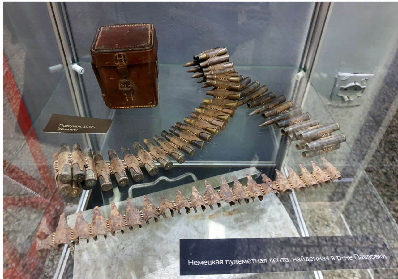
Немецкая пулеметная лента, найденная в р-не Павловки

Немецкая пулеметная лента, найденная в районе Павловки.