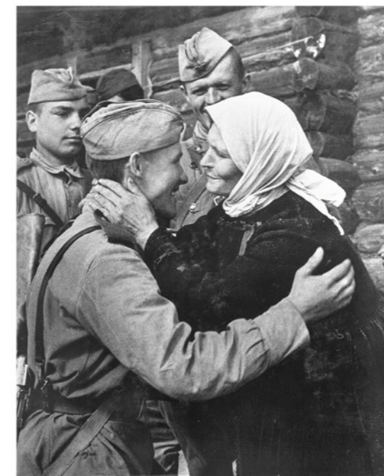
► Советский солдат встретился с матерью. Оригинальное название фото: «Здравствуй, сынок!» Лето 1943 года.

Кстати, ни одна из мам не знала, что их ждет такой замечательный сюрприз. Дети и классный руководитель готовили первый в стране День матери в строжайшем секрете. Сначала был составлен сценарий праздника, одновременно с репетициями делали костюмы и декорации. То есть подход к делу был более чем серьезным. В итоге праздник получился настолько ярким, что о нем даже сообщили в союзной прессе. И тогда зашла речь о том, что неплохо было бы придать Дню матери официальный статус на уровне всей страны.