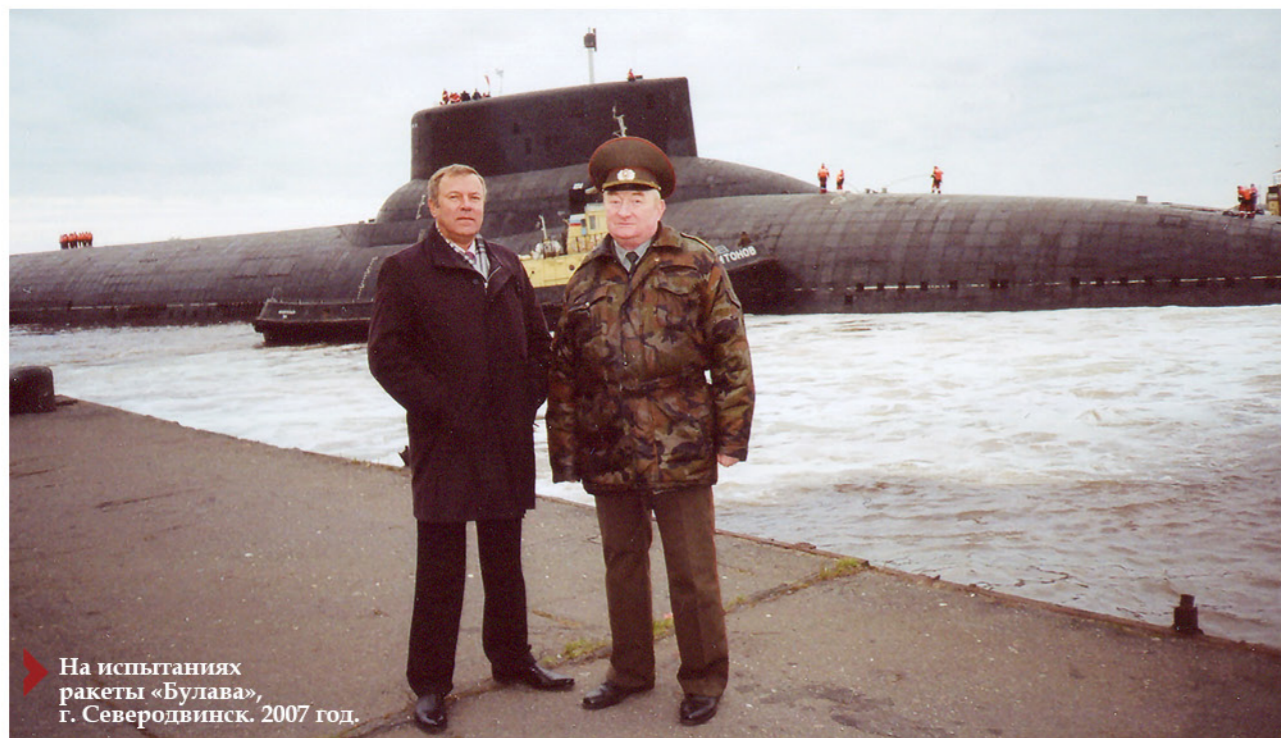
➤ На испытаниях ракеты «Булава», г. Северодвинск. 2007 год.