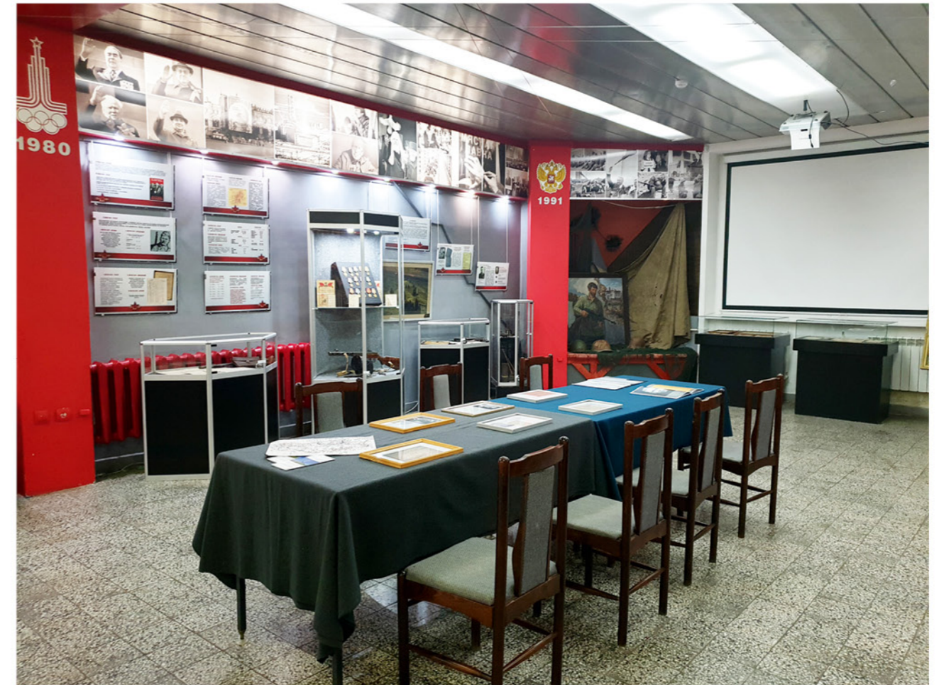
▶ На выставке представлены документы, награды и артефакты времен Великой Отечественной войны.