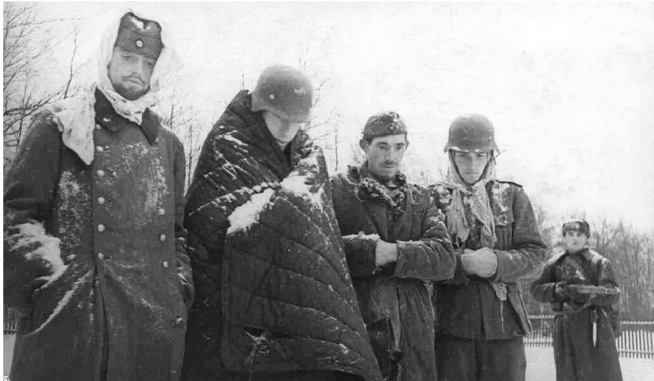
➤ Эта фотография пленных немцев должна остаться в памяти всех россиян.