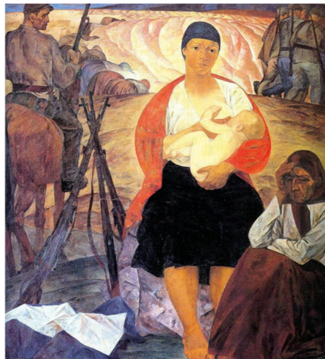
► «Партизанская мадонна» Михаила Савицкого известна всему миру. Торжествуя над войной и разрухой, она всеильна и всемогуща, ибо она Мать...

Педагог с огромным энтузиазмом восприняла идею и пошла детям навстречу. Подготовка к празднику для мам шла целый месяц.