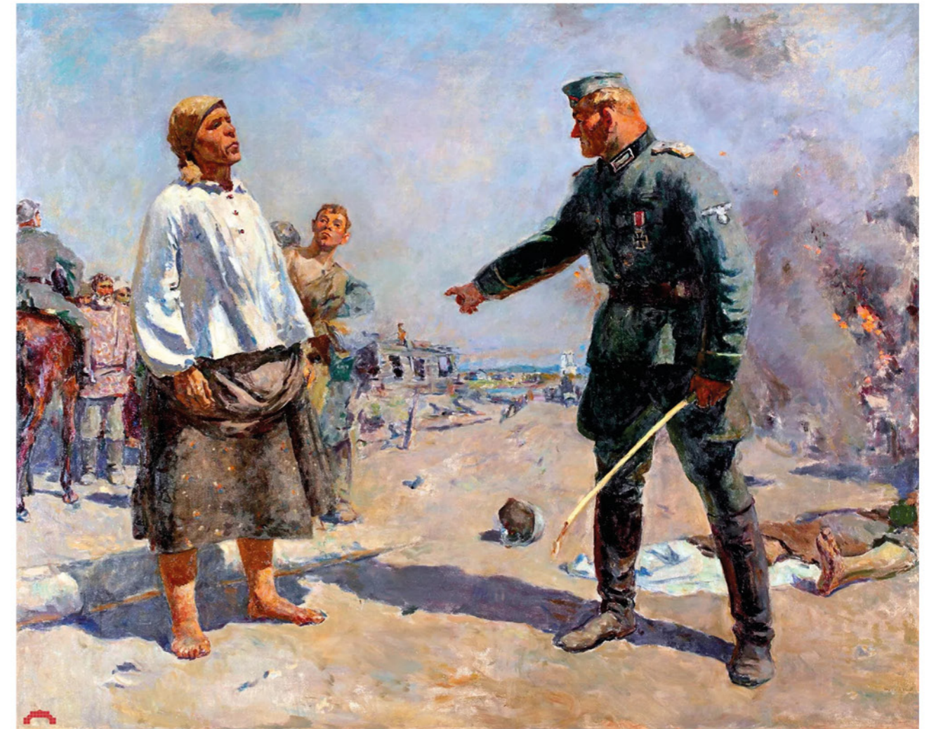
► Сергей Васильевич Герасимов «Мать партизана». Холст, масло. Третьяковская галерея.