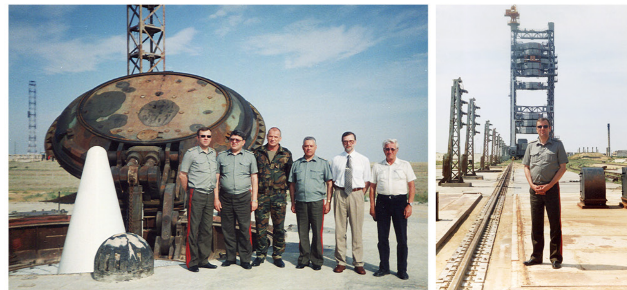
➤ Космодром «Байконур». На испытаниях новой ракеты. 2000 год.